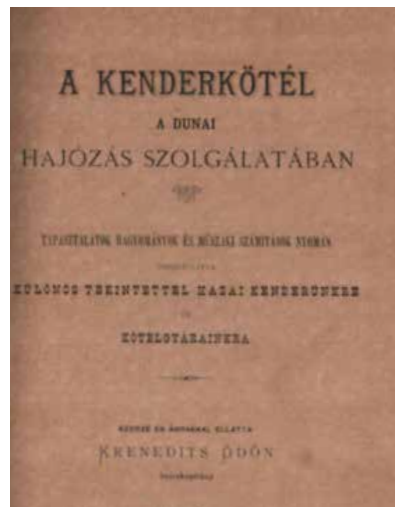
Krenedits Ödön: Kenderkötél a dunai hajózási szolgálatában című művének címlapja (1896)