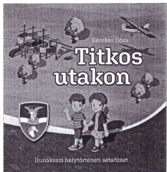
A dunakesziek helytörténeti sétafüzete

A családi, baráti sétákhoz a 10 évnél fiatalabb korosztály számára alkottuk meg a 2021-ben először, majd 2023-ban másodszor is kiadott Titkos utakon című helytörténeti sétafüzetet, amelynek segítségével végigjárhatják településünket. A 10 évnél idősebbek (így a felnőttek) számára is az Actionbound nevű alkalmazásban készítettünk el 6 sétaútvonalat, amelyek off- és online módban is működnek, eredményük pedig opcionálisan fel-