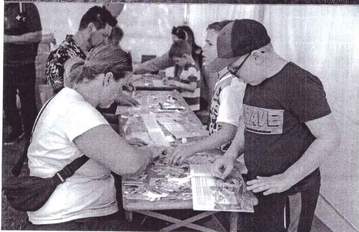
Matricagyűjtés az identitáserősítés szolgálatában