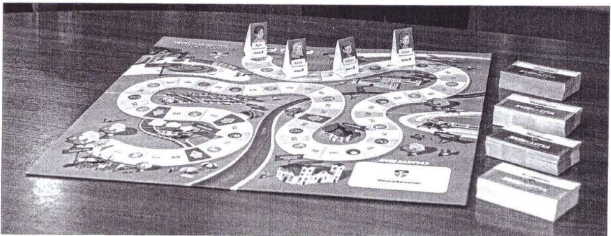
„Sétáljunk együtt Dunakeszin!” társasjáték

Az alsó tagozatosok múzeumpedagógiai óráit is a három helytörténeti mesekönyv határozza meg. Itt már a digitális világ eszköztárával élve elevenedik meg az órarendbe épített helytörténeti foglalkozás. Az ezt választó pedagógusok osztályaival elsőben kezdjük meg