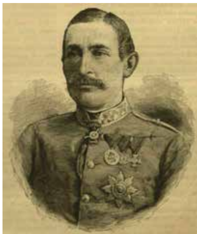
Rumai gróf Pejácsevich Miklós (1833–1890)

1889. szeptember 19. és 21. között tartották meg Dunakeszin és környékén az Osztrák–Magyar Monarchia az évi hadgyakorlatát, amelyhez kapcsolódóan egy kedves adoma is maradt az utókorra Habsburg–Tescheni Albert Ferenc főherceg (1817–1895) főhadparancsnokról, pontosabban annak lováról.