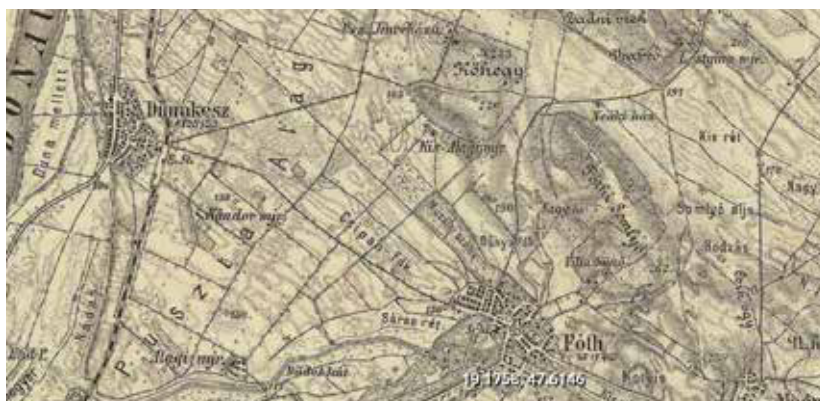
A hadgyakorlati terület az III. katonai felmérésen (1869–1887)

A IV. hadtestet két részre, egy északi és egy déli seregre osztották fel. Az északi parancsnoka, Groler altábornagy, Vácott és környékén szállásolta el 2 tábornokát, 18 törzs- és 206 főtisztjét, 6350 katonáját, 450 lovat és a 30 ágyút, amelyet magukkal hoztak. A déli had-