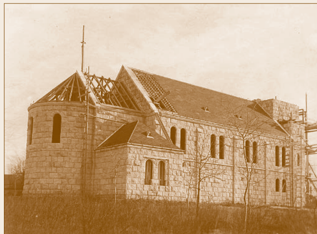
Az épülő Szent Imre-templom (1937)

Ez a magatartás erős ellentétben állt a két világháború közötti időszak állami egyházipolitikájával, amely nagymértékben támaszkodott az egyházak oktató, kulturális, morális, sőt gazdasági tevékenységére is, továbbá segítette azok működését. Ebben a korszakban Dunakeszin két katolikus (Szent Imre, Jézus Szíve) és az evangélikus templom épült, kibővítették a Szent Mihály-templomot, létrejött a Katolikus Agrárfiújsági Legényegyletek Országos Testületének helyi szervezete, asszony- és leánykörök alakultak, cserkészcsapatok működtek, számos lelkigyakorlatot tartottak, zarándoklatokat szerveztek stb.