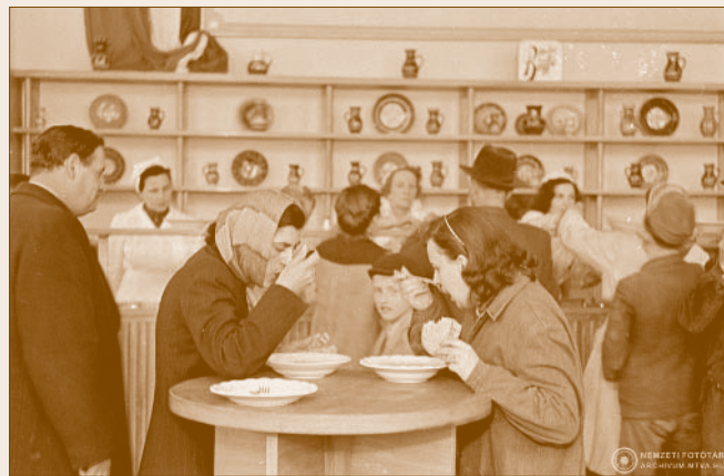
Népbüfé Újpesten (1952)

italbolt és a népbüfé vette át, amelyekről már nevük alapján is sejthetjük, hogy egyet jelentettek a gyors, olcsó, kényelmetlen, igénytelen kifejezésekkel. 2