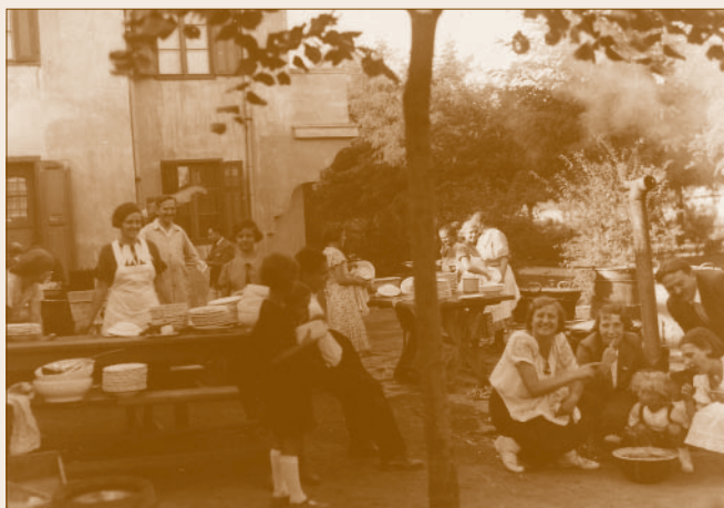
A Rozsnyai vendéglő kerthelyisége az 1920-as években

A 19. század végén Budapesten, majd annak mintájára a vidéki nagyvárosokban is a szórakozásnak számos színtere alakult ki. A már meglévő kocsmák mellett kávéházak, vendéglők, csárdák sokasága várta a mulatni vágyó úri (vagy nem éppen úri) közönséget. Az első világháború, majd az azt követő gazdasági válságok hatására a vendéglátás csorbát szenvedett, de az erre irányuló igény erős maradt a magyar társadalomban. A második világháború után, az 1940-es évek végén, az 1950-es évek elején egyre-másra államosították a vendéglátóhelyeket. Dunakeszin is állami tulajdonba kerültek olyan, saját korukban legendás intézmények, mint a Mogony, a Rozsnyai vagy a Szalay vendéglő.