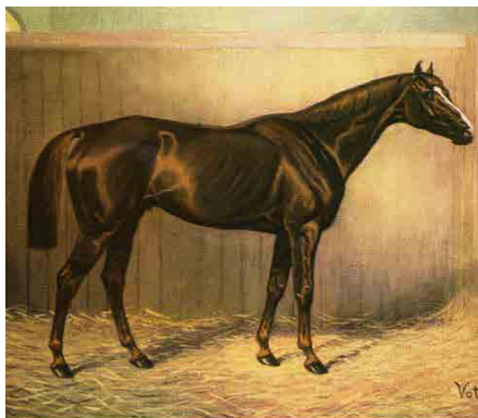
50. kép: Vatinius