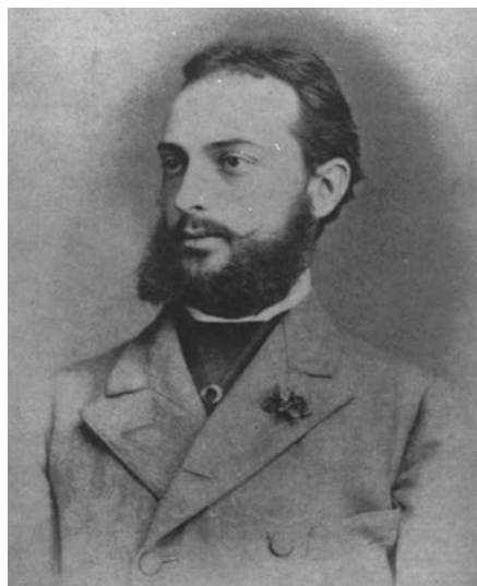
2. kép: Gróf Batthyány Elemér

tevékenysége nyomán fellendülő magyar lósporthoz ettől kezdve egyik centruma lett Alag, amely tréningközpontként és versenyhelyszínként is jelentősnek mondható. A Lovaregylet megjelenése és tevékenysége a településre is hatással volt, új létesítmények épültek, jelentősen bővült a lakossága, infrastrukturális fejlődése pedig káprázatosnak mondható. Ebben az időszakban vasútállomás, csendőrség, iskola, községháza épül Alagon, számos villát, és ennek megfelelően nagyszámú cselédlakást építenek a községben. 46