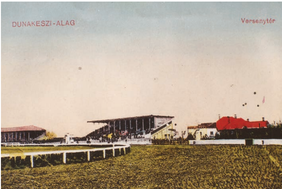
3. kép: Versenyter, Dunakeszi-Alag

Eredetileg négy gyakorlópályát terveztek, de a megvalósításuk elmaradt. 1892-ben viszont megépült az 1000 főt befogadó tribün, amely nyolc méter magas volt, és a Jakabfy és Szabó budapesti építészeti iroda tervezte. Ezt követően már nem évi kettő, hanem – áprilisban, júniusban és augusztusban – hét verseny megrendezésére is sor kerülhetett. Ekkortól