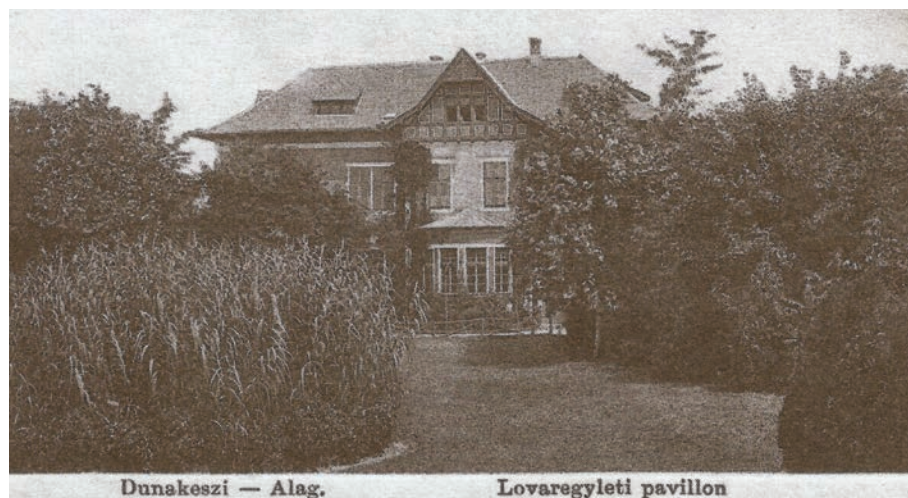
7. kép: A lovaregyleti pavilon

kaphattak. A szezon idején zsokék, trénerek és szakújságírók is látogattak, de az istállótulajdonosok is rendszeresen betértek. Itt találkoztak a bálók vendégei, itt ünnepelték a derbik győzteseit, de az alagi csikóárverésre érkezők is itt szállhattak meg. Krúdy Gyula, Heltai Jenő, Szép Ernő és még sok más író és művészember, akik rajongtak a turfért, alagi látogatásuk alkalmával szívesen voltak a Pavilon vendégei. Az itt szerzett benyomásaikat később felhasználták műveikben. 71 A második világháborúig a Pavilon az alagiak közkedvelt találkozóhelye volt, ezután tovább működött, de elvesztette varázsát. Némileg leromlott, majd megszűnt mint vendéglátóhely, végül 2006 márciusában lebontották. 72