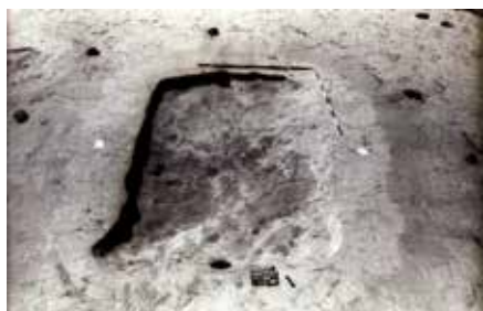
1. kép: A 2133. sz. kelta ház fotója

A területen feltárt másik, viszonylag értékelhető állapotban