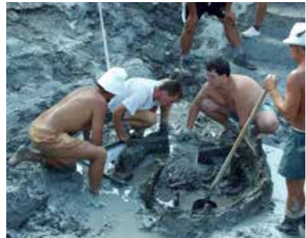
7-11. kép: A 2110. sz. kelta kút bontása és felszedése