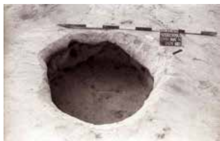
5. kép: A 2025. sz. méhkas alakú kelta tároló gödör