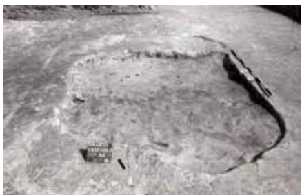
4. kép: A 2571. sz. kelta ház