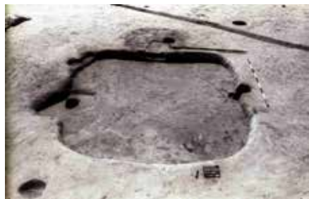
3. kép: A 1549. sz. kelta ház