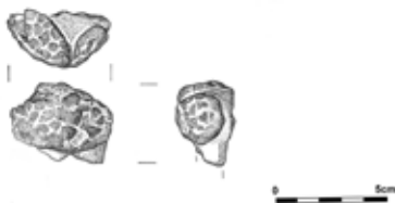
3. kép: Neolitikus agyag szoborfej az 1777-es objektumból

A település leleteinek kora az újkőkoron belül nagy szóródást mutat. A legtöbb edénytöradék a dunántúli vonaldíszes kultúra legidősebb, Bicske-Biñainak nevezett 9 fázisából