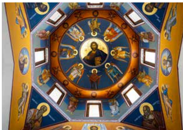
A Szent Péter és Pál-templom (2023)

A BARÁTSÁG ÚTI LAKÓTELEP ÉS A KEGYELETI PARK ÖLELÉSÉBEN ÁLL DUNAKESZI LEGFIATALABB TEMPLOMA, A SZENT PÉTER ÉS PÁL GÖRÖGKATOLIKUS TEMPLOM. ÉPÍTÉSE 2012-BEN KEZDŐDÖTT, KÖZÖSSÉGI ÖSSZEFOGÁSSAL. A PÉNZALAPOT UGYANIS TIZENKÉT EMBER ADOMÁNYA JELENTETTE, AKIK AZ ÉPÜLŐ TEMPLOM URNATEMETŐJÉBEN SÍRHELYÜKET VÁLTOTTÁK MEG.