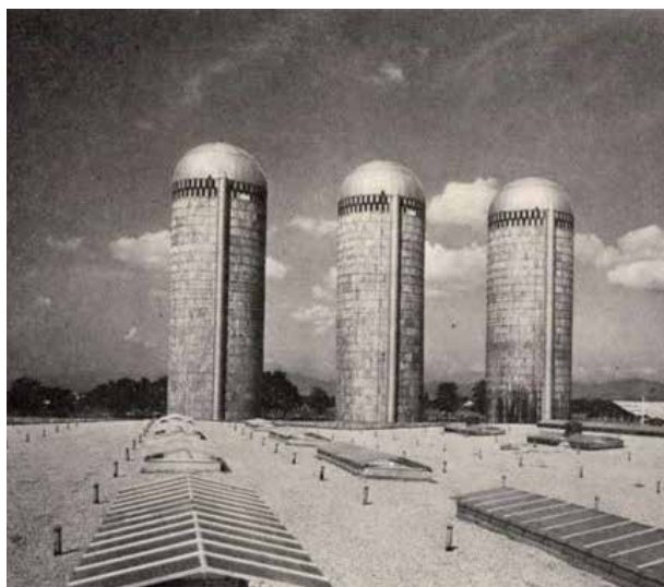
A tehenészet toronysilói (1972)

Ahogy az országban másutt is, eleinte csak a belső javítások elvégzésére tartottak fenn műhelyeket. Később ezek terjeszkedni kezdtek, majd 1981-ben – Szuperszolg néven – közös gazdasági társaságot hoztak létre a hernádi Március 15. téesszel, amelynek telephelyei Dunakeszi alagi részén és Rákospalotán voltak. Érdekes találmányuk a Superaquának nevezett termék, amelynek alkalmazásával a csatornahálózatot vegyszeres úton, az útburkolat felbontása nélkül is javítani lehetett. A terméket még Nagy-Britanniába is szállították.