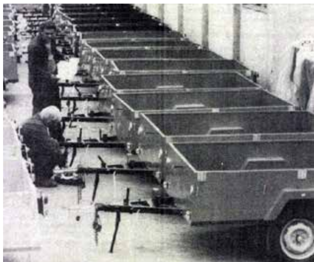
Farmer utánfutók (1982)

75 ÉVE, 1948-BAN, A KORÁBBAN A MAGYAR LOVAREGYLET BIRTOKÁBAN ÁLLÓ, 80,5 HEKTÁR NAGYSÁGÚ ALAGI-MAJOR ÁLLAMOSÍTÁSÁVAL JÖTT LÉTRE AZ ALAGI ÁLLAMI TANGAZDASÁG (AÁTG). A KÖVETKEZŐ ÉVTIZEDEKBEN NEM TÚL JÓ MINŐSÉGŰ TERMŐFÖLDTERÜLETE EGYRE NŐTT, SOK KÖRNYÉKBELI ÉS TÁVOLABB FEKVŐ TELEPÜLÉS FÖLDJEIT CSATOLTAK HOZZÁ. LEGSIKERESBB IDŐSZAKA AZ 1970-ES ÉS 1980-AS ÉVEKRE ESETT, NAGYSÁGA EKKOR 5860 HEKTÁR, KITERJEDÉSE ÉSZAK-DÉLI IRÁNYBAN 98 KM VOLT.