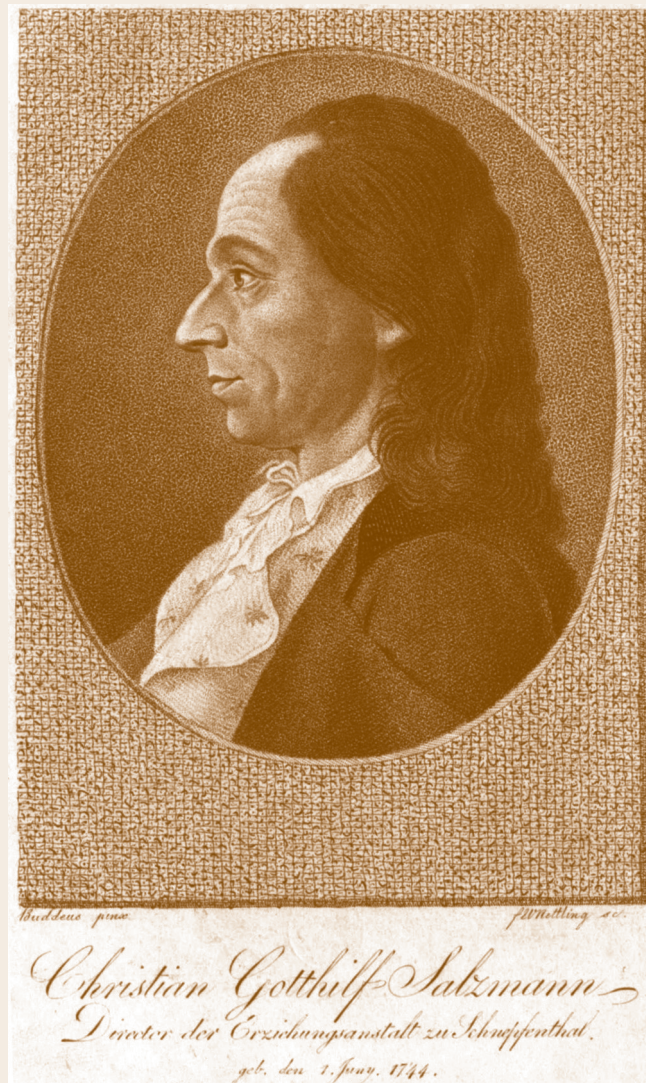
Tsisch pedagógiai példaképe: Christian Gotthilf Salzmann

gyobbak ezt követően önállóan, a kisebbek segítséggel tisztálkodtak, felöltöztek, rendbe tették ágyaikat, szobáikat, elhajtogatták ruháikat. Közös imát követően együtt reggeliztek. 7 órakor kezdődött a tanítás, mindenki a korának megfelelő osztályban folytatta tanulmányait. A tanár addig maradt a csoporttal, amíg a következő órát tartó oktató oda nem ért. Óránként vagy kétóránként negyedóra szünet járt a tanulóknak. Az ebédre déli 12 órakor került sor, és szigorú rendben zajlott. A tanárok felügyelték, hogy senki se szegje meg a szabályokat. Délután 2 és 6 óra között ismét tanórákra került sor, majd 6 és 7 között zene, tánc vagy más művészeti oktatásban részesültek a diákok. Este 7-kor volt vacsora, amelyet ismét tanáraik társaságában költöttek el. Vacsora után séta vagy játék, majd 9 órakor közös imát tartottak, utána tisztálkodás, öltözés, végül alvás következett. 16