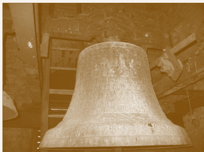
A nagyharang a Szent Mihály-templom északi tornyában