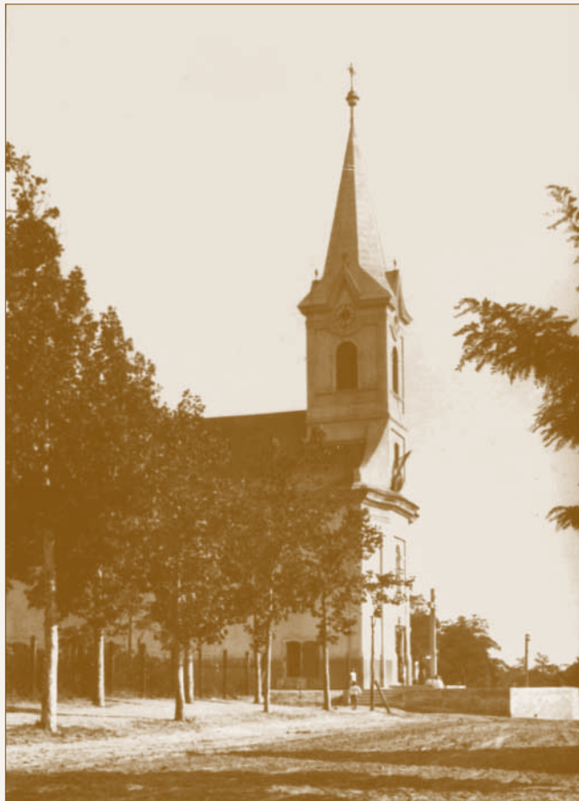
Az öreg Szent Mihály-templom 19

„Öntetett Szent István király tiszteletére, öntötte Walser Ferenc, Budapesten, 1892. 2044. sz.” 18