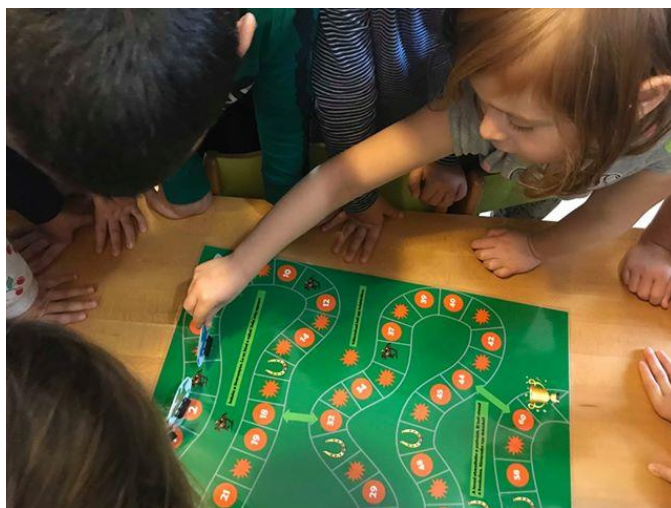
Lóverseny foglalkozás és társasjáték