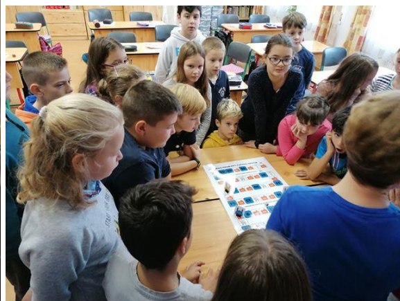
Megnéztük a Szent Mihály-templomot és társast is játszottunk róla (sok-sok kvízkérdéssel)