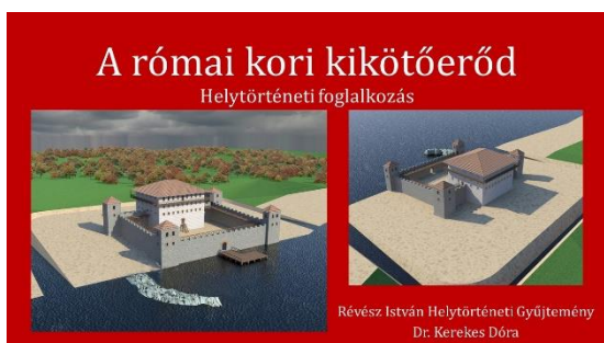
Római kori foglalkozás iskolásoknak