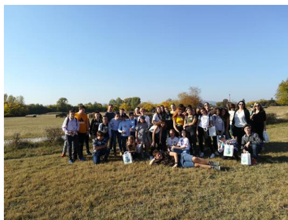
Kirándulás a lóversenypályára és a repülőtérré