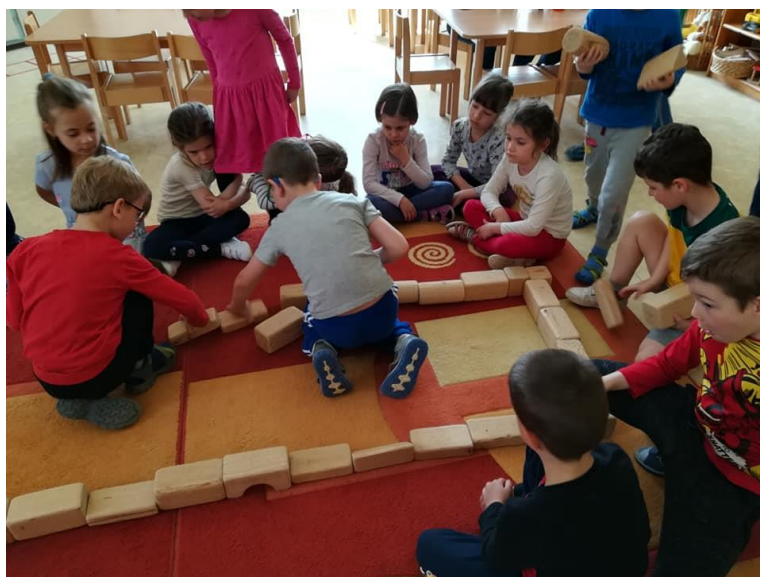
Repülőtérről szóló foglalkozás