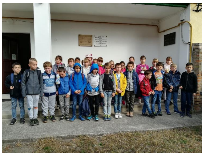
Látogatók a gyűjteményben