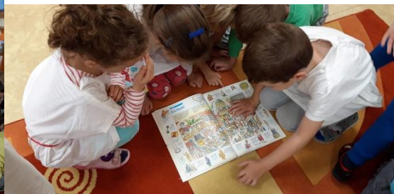
Római kori kikötőerőd óvodásoknak